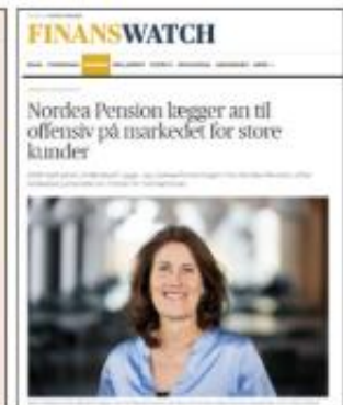
Nordea Pension i medierne